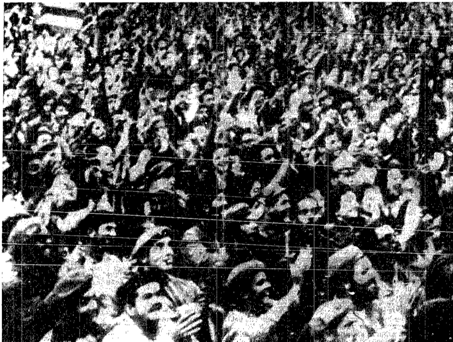
Funkbild aus Havanna: Hunderttausende von Kubanern jubeln dem Hysteriker Castro zu, als er den „totalen Widerstand“ gegen die amerikanische Blockade proklamierte. Ob sich wohl einer dieser Menschen im klaren darüber ist, was ihr Diktator angedacht hat, als er die Sowjetrussen ermunterte, eine Basis zum Abschuß von Raketen auf Kuba zu bauen?

sprengköpfen weitergeht. Seitdem wird stündlich erwartet, daß Präsident Kennedy neue, schärfere Maßnahmen gegen Kuba befiehlt. Bei Redaktionsanfragen lag die Möglichkeit einer direkten militärischen Besetzung Kubas durch amerikanische Streit-