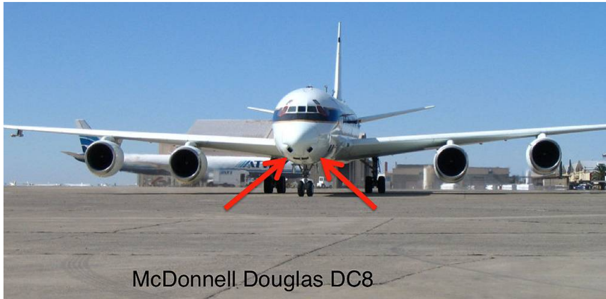
Abb. 2: Ram-Air Lufteinlässe DC 8

Dieses aus heutiger Sicht mangelhafte Konstruktionsprinzip haben leider auch noch alle modernen Flugzeuge, bis hin zum Airbus A380.