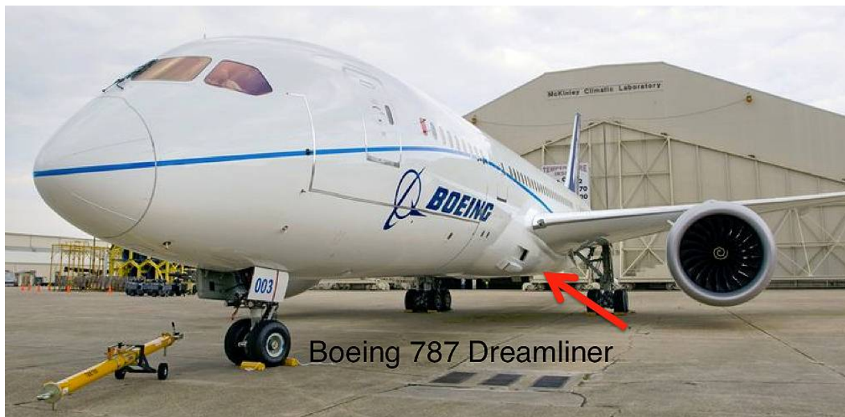
Abb. 3: Ram-Air Lufteinlässe Boeing 787

Erst der neue Boeing 787 Dreamliner, der kürzlich bei dem japanischen Erstkunden ANA in Dienst gestellt wurde, bezieht die Kabinenluft wieder aus Ansaugstutzen, so wie bereits in den 50er Jahren üblich.