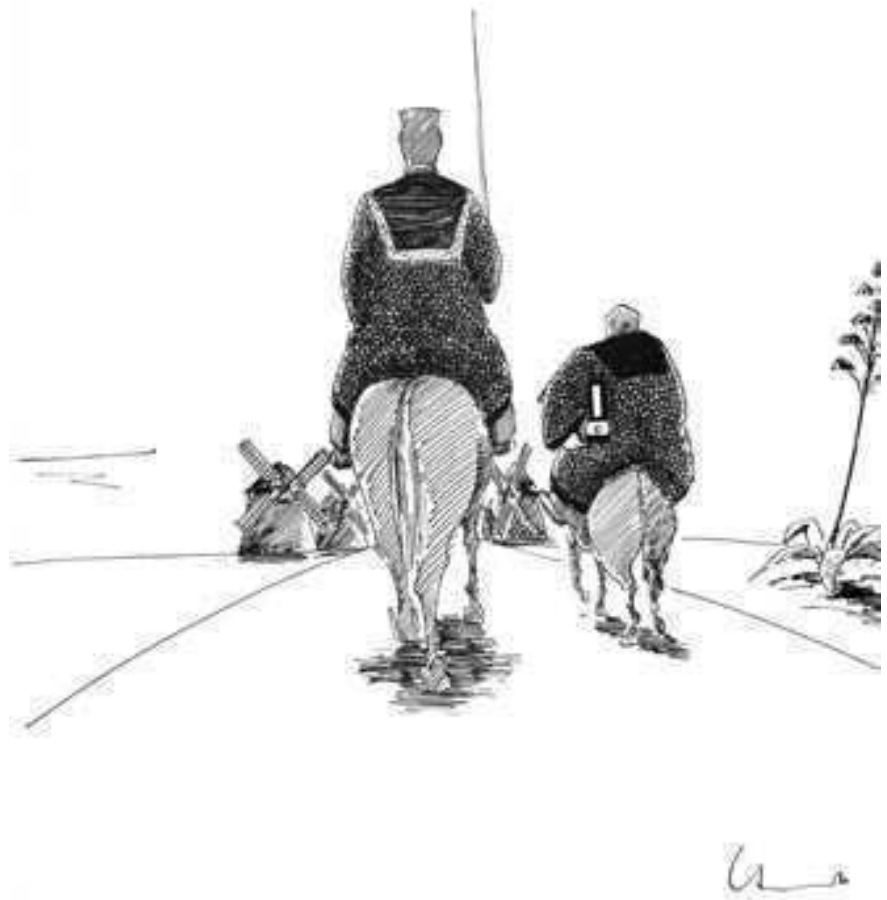
Zeichnung: Philipp Heinisch

H. K.: Nach dem Eingang der Klagerwiderrung legt der Berichterstatter innerhalb einer bestimmten Frist sein Votum vor. Das ist die Grundlage der mündlichen Verhandlung. Die rechtliche Erörterung ist nicht so umfassend, wie wir es heutzutage in Deutschland gewohnt sind. Auch von den Möglichkeiten der Sachaufklärung durch Beweisaufnahme wird weniger Gebrauch