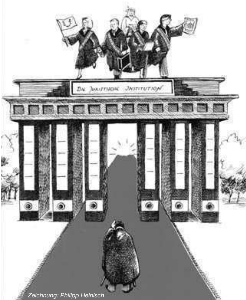
Zeichnung: Philipp Heinisch