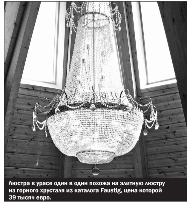
Люстра в уресе один в один похожа на элитную люстру из горного хрусталя из каталога Faustig, цена которой 39 тысяч евро.