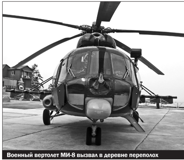
Военный вертолет МИ-8 вызвал в деревне переполох

— Еще рано говорить о конечной стоимости объекта. Проектно-сметная документация сейчас проходит проверку.